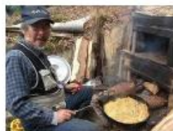
右 たけのこ、上手に廻れるかな 中上 ここは原じいの指定席 中下 マシュマロを焼いたらとろとろに 左 絶品! たけのこピザ