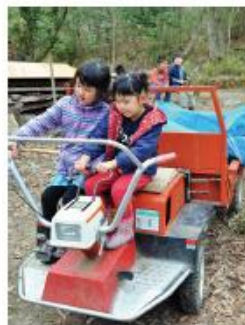
左上 木を運ぶ車に乗って 左下 手づくりシーソーは楽しい! 中下 人の手が入ることので守られる里山 左下 あったかいお鍋は人の心を近づける