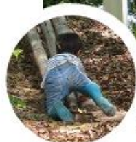
ころんだって泣かないもん!